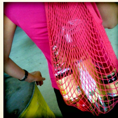
Filet en Coton Bio