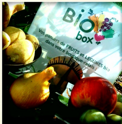
Fruits & Légumes