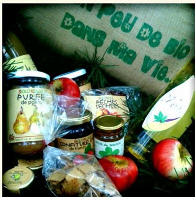
Panier de Noel